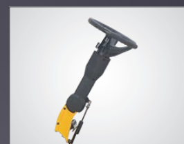
COLONNE DE DIRECTION AJUSTABLE