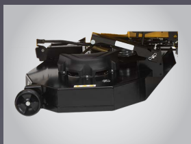
PLATEAU DE COUPE MÉCANO-SOUDÉ