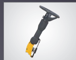
COLONNE DE DIRECTION AJUSTABLE