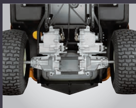
DOUBLE TRANSMISSION HYDROSTATIQUE