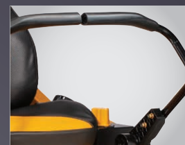
LEVIERS AVEC GRIP SOFT TOUCH ANTI-VIBRATION