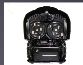
DOUBLE PLATEAU DE COUPE