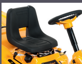
SIÈGE ET VOLANT CONFORT