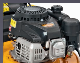
MOTEUR PUISSANT OHV CUB CADET