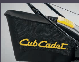
GRAND BAC DE RAMASSAGE