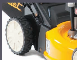
ROUEMENTS À BILLES DOUBLES