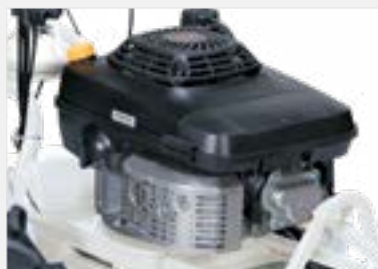
MOTEUR KAWASAKI PUISSANT Cylindrée : 182 cm 3