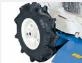
ROUES AGRAIRES Pour une meilleure adhérence